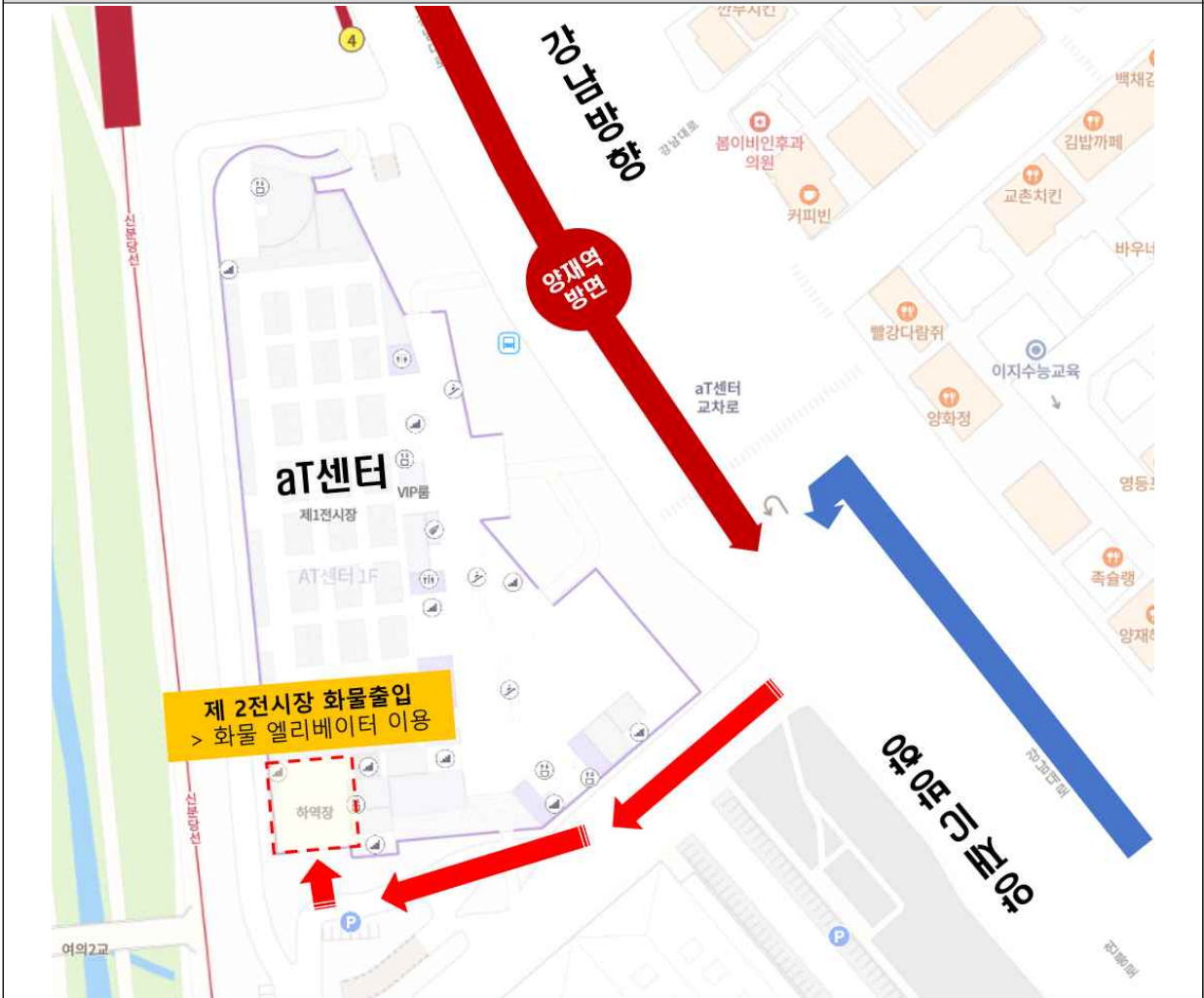
[참고] 화물 엘리베이터